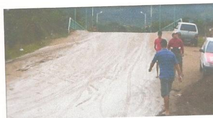
Rua Vigário Trajano