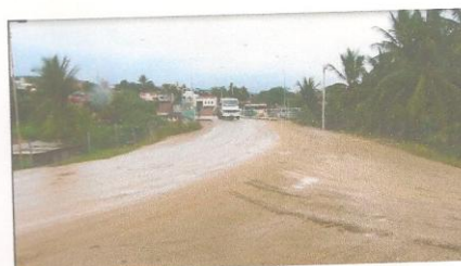
Rua Siqueira Campos