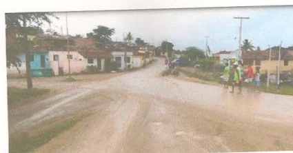
R. DR. Antônio Sales