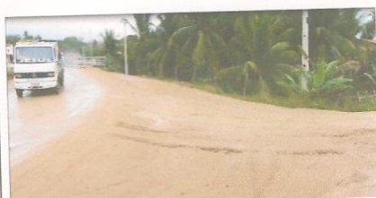
Rua Siqueira Campos