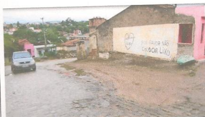
R. Antônio Ferreira Bilar