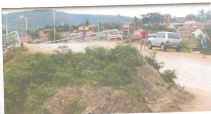
Rua Vigário Trajano